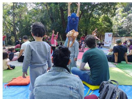
Figura 7 - EmQuanta: ação artística no Parque da Aclimação, 05/06/2022