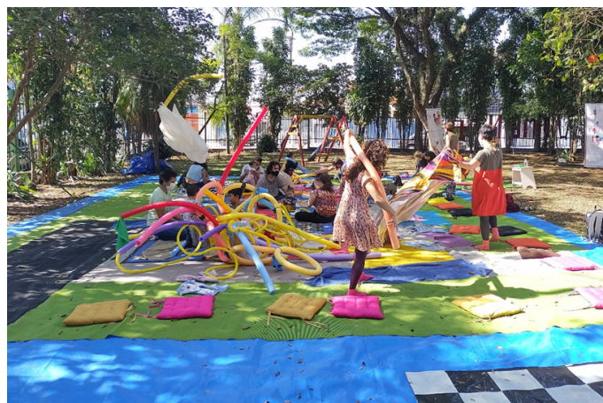
Figura 2 - EmQuanta : ação artística no jardim da Biblioteca Pública Álvares de Azevedo, 02/07/2022

No início da execução do projeto, no entanto, os parques municipais ainda não estavam liberados para o agendamento de ações artísticas e culturais, o que trouxe uma pequena adaptação no projeto para a apresentação das ações nos jardins e praças adjacentes de bibliotecas públicas municipais, com a posterior adesão ao projeto do Parque da Aclimação. Executamos assim dez apresentações do EmQuanta em cinco equipamentos públicos, nas quatro regiões da cidade de São Paulo: Biblioteca infantojuvenil Monteiro Lobato (centro); Biblioteca Hans Christian Andersen (leste); Biblioteca Álvares de Azevedo (norte); Biblioteca Álvaro Guerra (oeste) e Parque da Aclimação (sul).