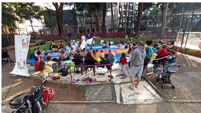
Figura 5 - EmQuanta : ação artística no parque da Biblioteca Municipal Infantojuvenil Monteiro Lobato, 21/05/2022.