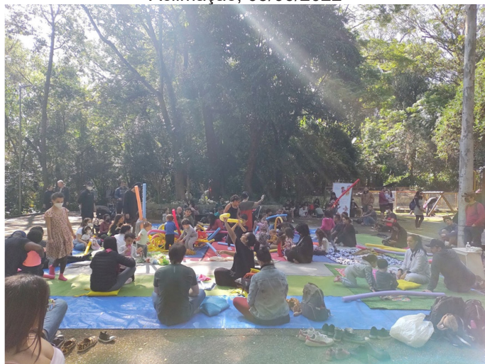
Figura 4 - EmQuanta: ação artística no Parque da Aclimação, 05/06/2022

A paisagem está entre o espaço e o lugar, é a experiência do sujeito com o mundo que ele experimenta, reconstrói e ressignifica. (...) Ela diz respeito à experiência dos sentidos, do pensamento e da recepção estética em jogo com a materialidade, com o terreno (Schuquel, 2021, p.4).