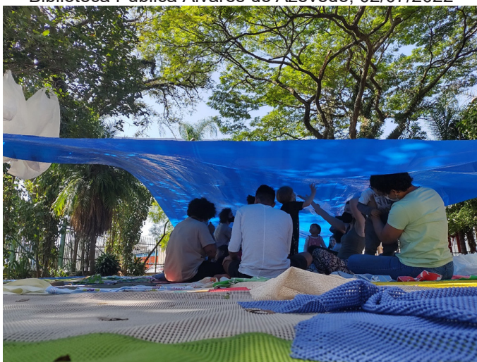
Figura 6 - EmQuanta: ação artística no jardim da Biblioteca Pública Álvares de Azevedo, 02/07/2022

Assim como na primeira infância, encontramos um convívio que se fundamenta na experiência e na percepção. Os saberes corporais, a improvisação, a imprevisibilidade, o tempo, a energia, o impulso colocam-se, para os artistas, as crianças e os adultos, como formas singulares de se estar no mundo. A partir da percepção do corpo e da escritura desse corpo no movimento, encontra-se o diálogo entre a ação, a apresentação e a observação. Crianças e adultos encontram-se como performers da ação cênica, podendo, inclusive, interferir, destruir e reconstruir os elementos ali em jogo. Abandona-se o foco no artista como condutor da experiência cênica, dirigindo-a à experiência do corpo no espaço, tornando as intervenções humanas uma imersão ativa na cena.