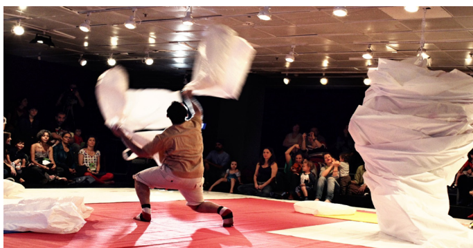
Figura 1 - EmQuanta: dança para crianças pequenas e seus pais . Itaú Cultural, 2013.

iniciativa visou à retomada das ações artísticas e formativas do grupo pela cidade de São Paulo, após os dois anos de distanciamento social impostos pela pandemia de covid-19. Nesse momento delicado de reencontro, optou-se por adaptar o espetáculo EmQuanta: dança para crianças pequenas e seus pais , para uma ação artística que ocupasse parques municipais de diferentes territórios da cidade, espalhados por entre suas quatro regiões (norte, centro-oeste, sul e leste), devido ao período de readaptação ao convívio social e à necessidade de ainda se adotar algumas medidas sanitárias de prevenção à doença.