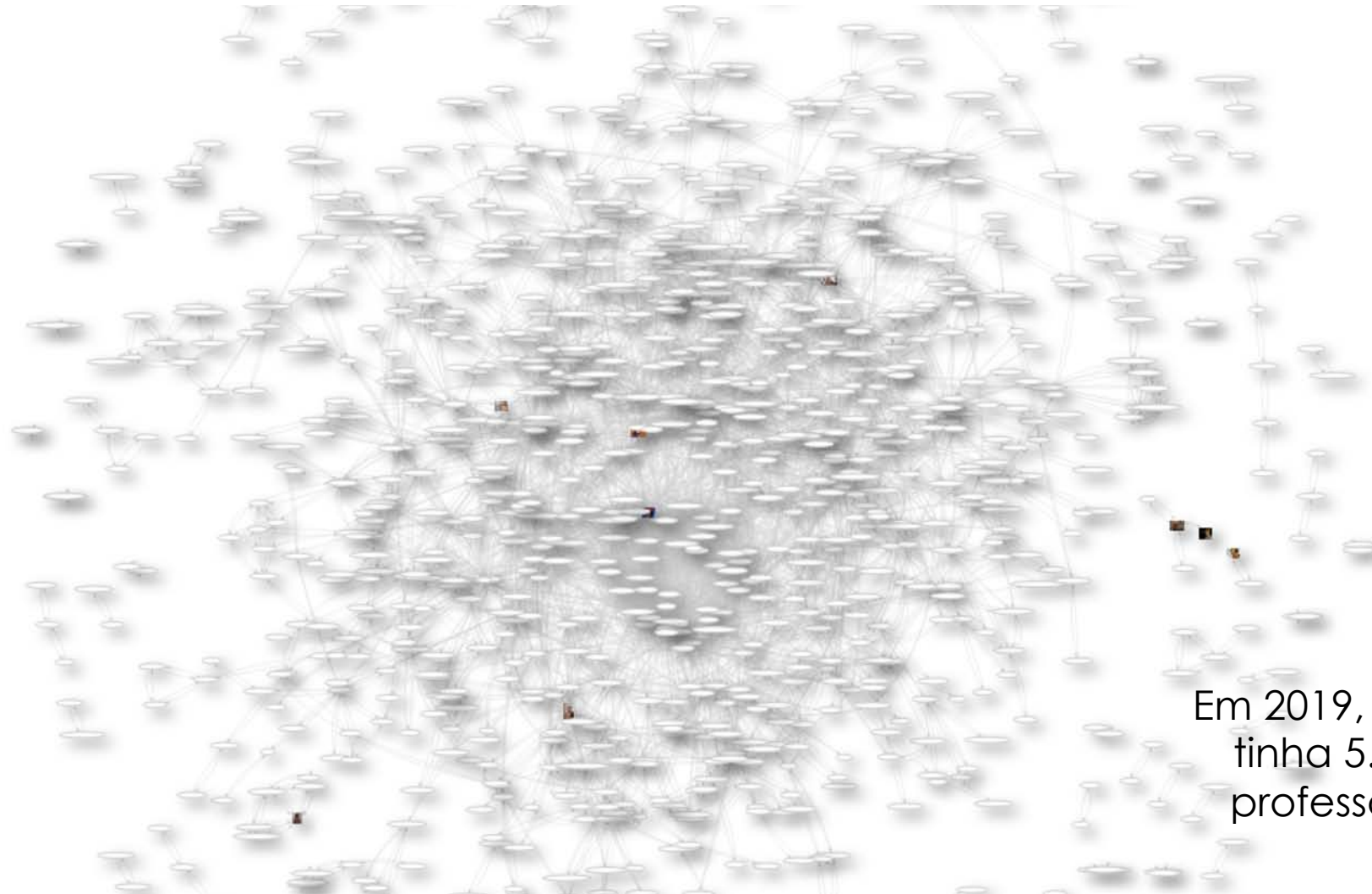
Gráfico de coautorias na Universidade de São Paulo (USP): empregados, afiliados e membros antigos e atuais