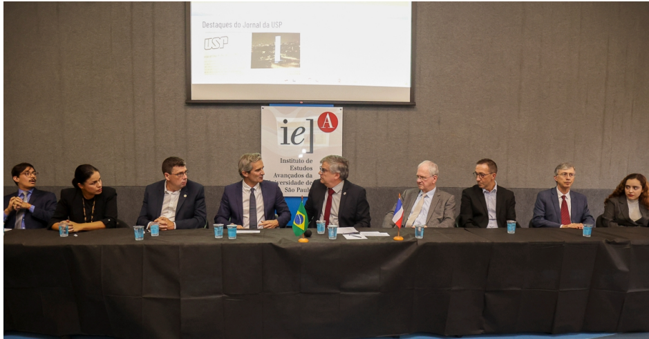
Dirigentes da USP e das universidades francesas e alunos do curso de Direito participantes do programa Pites

Por Julia Queiroz* ( https://jornal.usp.br/autor/juliaqueirozp03usp-br/ )