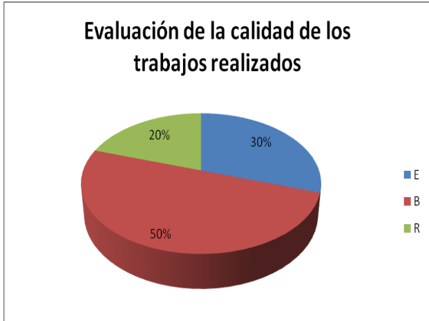
FIGURA 2. Evaluación de la calidad de los trabajos realizados. Se observa que el 80% de los trabajos presentados obtienen una evaluación de Excelente o Bien.

En relación con la calidad de los trabajos presentados se muestran los resultados de la evaluación en la Fig. 2.