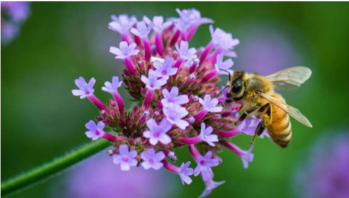
Abelhas contribuem para manter a biodiversidade vegetal na Terra

Nos últimos anos, apicultores e pesquisadores têm se preocupado com a diminuição da diversidade e população de abelhas, sendo que no Brasil, particularmente, são cada vez mais comuns episódios de mortandade desses insetos e de abandono de colmeias como consequência do uso extensivo de agrotóxicos. Mesmo em baixas concentrações, esses produtos químicos podem afetar o comportamento das abelhas, reduzindo seu tempo de vida e, conseqüentemente, evitando que elas façam seu nobre trabalho por mais tempo. Para os produtores de mel, por exemplo, identificar previamente se as abelhas estão expostas ou sendo intoxicadas por agrotóxicos é importante para a definição de estratégias que evitem prejuízos, como a transferência de colmeias para outro lugar.