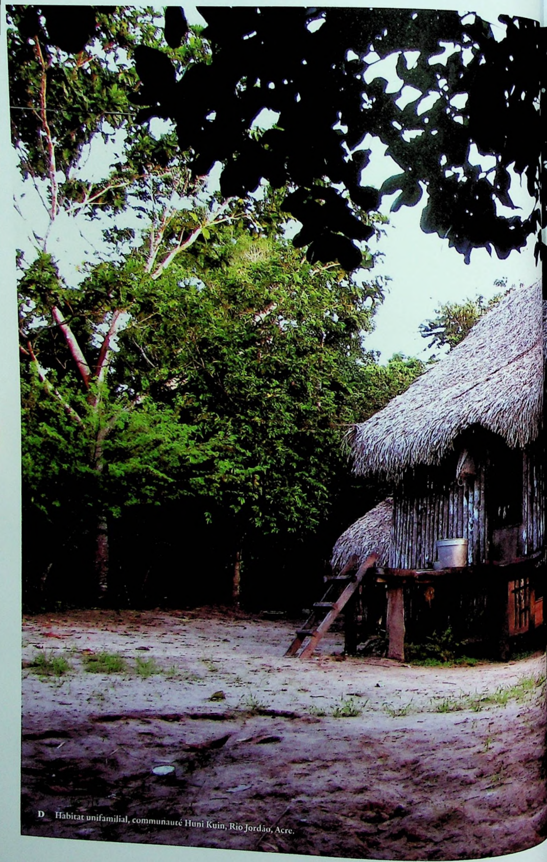
D Habitat unifamilial, communauté Huni Kuin, Rio Jordão, Acre.