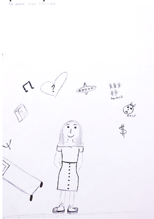
Figura 1. Desenho de uma participante (P10) do estudo de Batoni (2020).

Deste modo, o tema do PDE-Tema, escolhido por Batoni (2020), serviu para as participantes se aproximarem de modo relaxado e brincante do tema pesquisado, imaginando o futuro da mulher que, na sociedade em que vivemos, geralmente se vê sobrecarregadas pela dupla jornada caso decidam constituir família e se tornarem mães. As pesquisadoras trabalharam com um total de 30 participantes, que produziram 30 desenhos-estórias. Escolhemos dois deles, tendo em vista aqui proporcionar uma visão mais concreta desse material, enquanto tecemos alguns comentários à luz dos dois requisitos que discutimos neste texto.