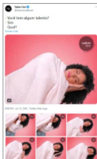
Figura 2. GIF animado utilizado pela Salon Line