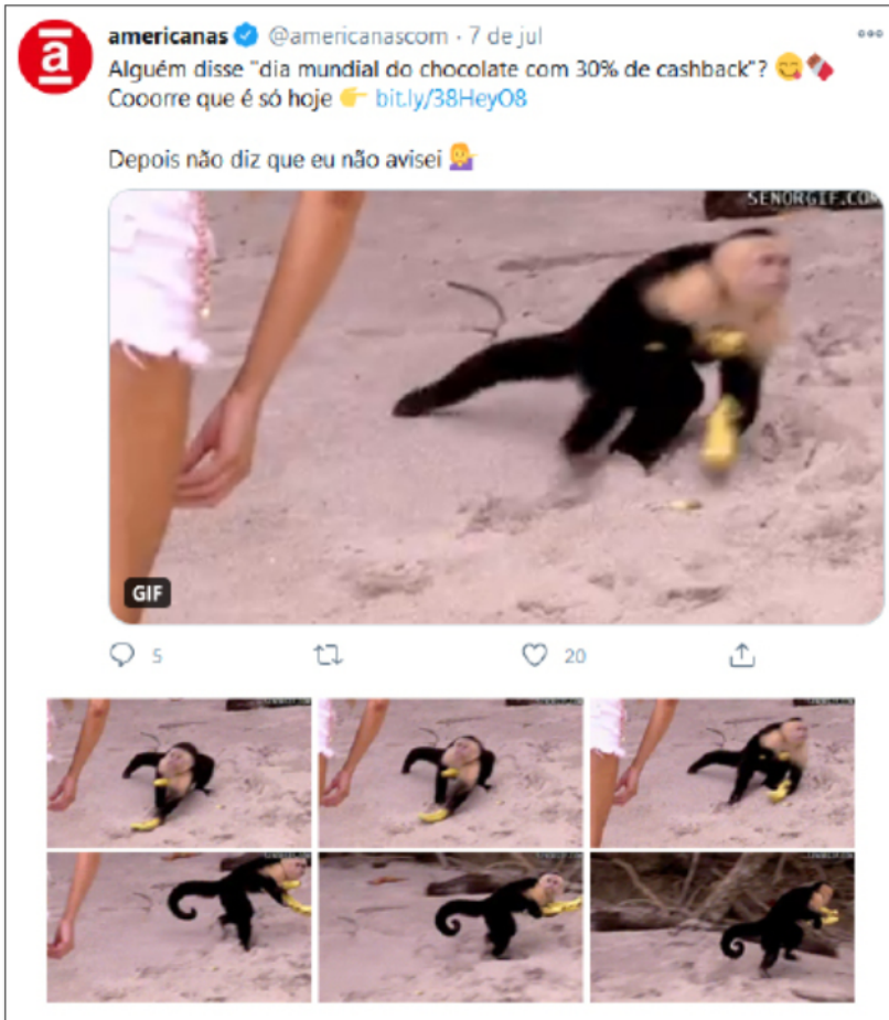
Figura 4. GIF animado utilizado pela Americanas.com.