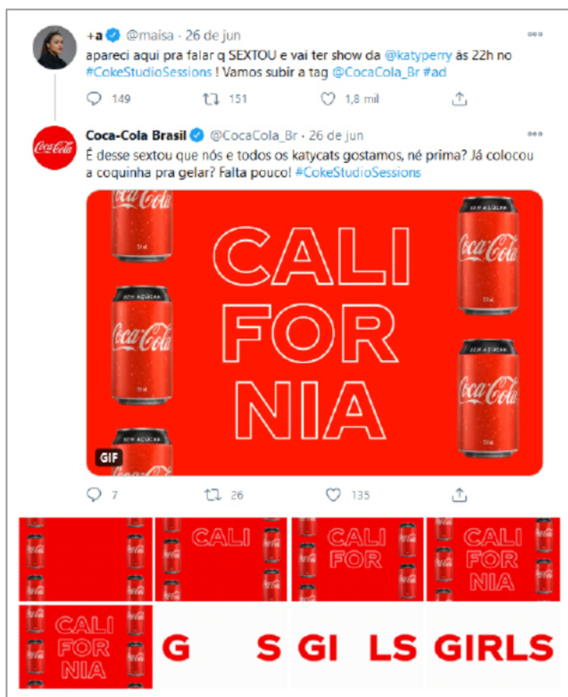
Figura 5. GIF animado utilizado pela Coca-Cola Brasil

A Coca-Cola Brasil parte para outra estratégia de uso publicitário do GIF animado (Figura 4), com aplicação de um GIF animado temático criado pela marca para divulgação do evento #CokeStudioSessions , cuja principal atração foi a apresentação da cantora Katy Perry. Este exemplo consiste em uma resposta à publicação publicitária patrocinada, denotada pelo uso da hashtag 10 #ad , feita por Maísa, personalidade da televisão brasileira e influenciadora digital. A Coca-Cola Brasil interage com Maísa em tom informal, como num diálogo entre amigas, utilizando um GIF animado. De autoria própria, o conteúdo utiliza as cores características da marca e a inserção de embalagens de seu produto.