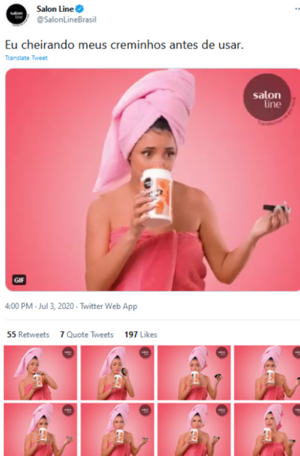
Figura 6. Tweet com GIF animado da Salon Line.