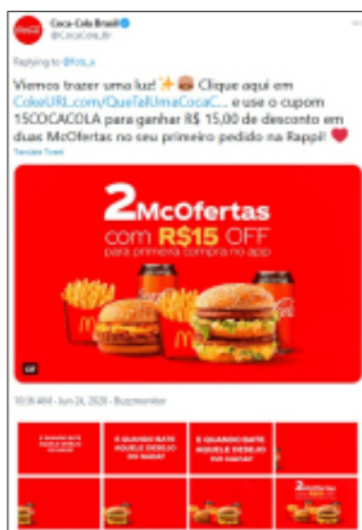
Figura 1. GIF animado utilizado pela Coca-Cola Brasil

Por exemplo, um GIF animado marcário pode ilustrar promoções, tendo caráter estritamente relacionado à divulgação de uma oferta específica. Na Figura 1, a Coca-Cola Brasil oferece cupom de desconto para compra de produtos Coca-Cola no restaurante McDonald's através do aplicativo Rappi. Ainda dentro do contexto publicitário, o objeto pode ser utilizado como expressão da marca, na qual a função básica da imagem é a aproximação com a gestualidade e sensibilidade dos interlocutores, como apresentado na Figura 2, em que a Salon Line cria uma publicação com um texto que é ironicamente complementado pela inserção do GIF.