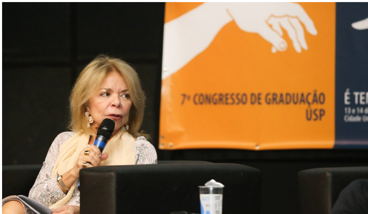
A vice-reitora Maria Arminda do Nascimento Arruda, na abertura do Congresso

São palestras, mesas-redondas, debates, oficinas e rodas de conversa sobre a experiência de formação de professores da Educação Básica, a transição do ensino médio para a universidade, metaverso, gamificação do ensino superior, escuta acadêmica e outros assuntos. As boas iniciativas no ensino de graduação também estarão representadas na sessão de pôsteres.