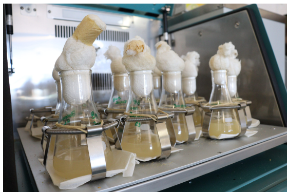
Bactérias da folha da laranja foram colocadas em frascos que continham amostras de pesticidas.