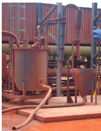
Figura 1. Fotografia da usina piloto.

A Figura 1 mostra a instalação montada para a condução dos ensaios.