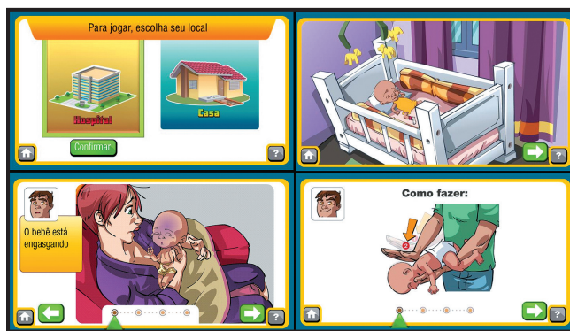
Figura 3 - Ambiente simulado do serious game e-Baby Família no âmbito domiciliar para reconhecimento de agravos em oxigenação e manejo pelos pais, Ribeirão Preto, São Paulo, Brasil, 2019

O e-Baby Família apresenta situações em ambiente simulado hospitalar (Figura 2) e domiciliar (Figura 3), que se relacionam com a