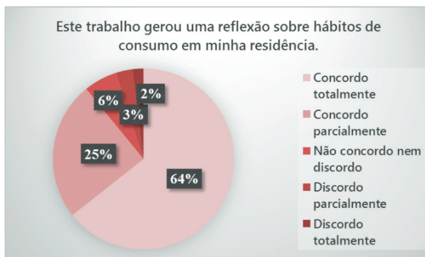
Figura 2 – O trabalho gerou reflexão sobre os hábitos de consumo dos alunos e de suas famílias.