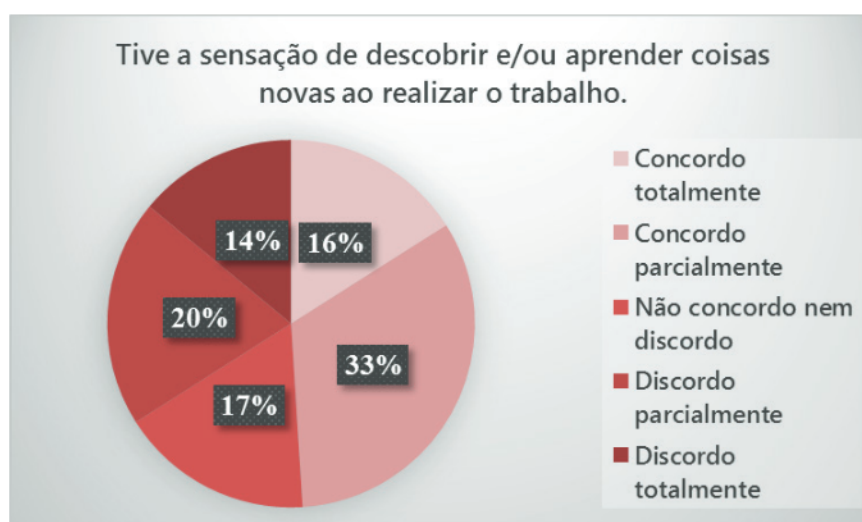
Figura 3 – Os alunos tiveram a sensação de aprender algo novo.