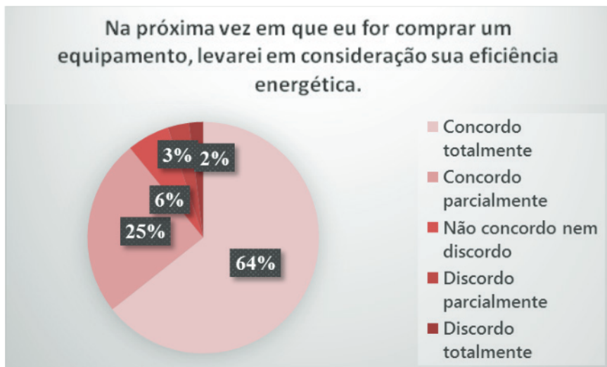
Figura 5 – Os alunos afirmam que vão considerar a eficiência energética dos equipamentos no momento da compra.

universidades, onde será? Observando as respostas livres na seção D do questionário, destacam-se comentários como: