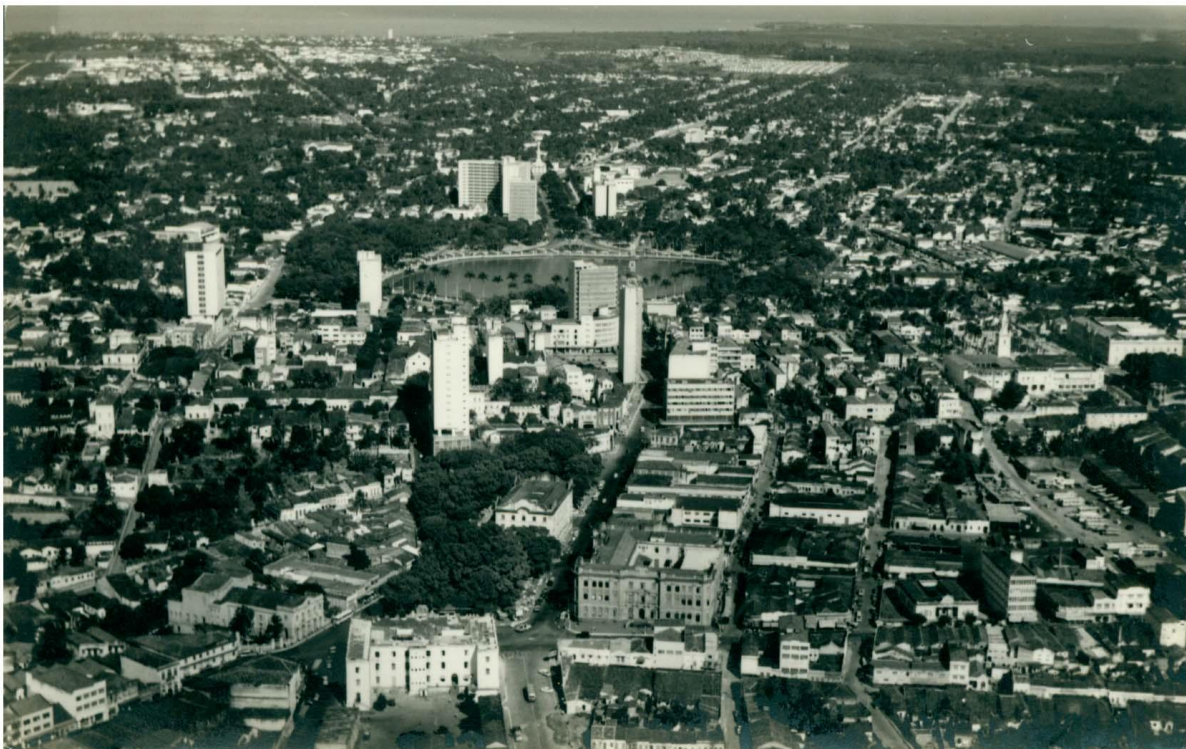
Figura 3: Vista aérea da região central de João Pessoa, começo da década de 1970, mostrando a verticalização em torno do Parque Solon de Lucena e do Ponto de Cem Réis.

“Aqueles dois exemplares das construções do século passado precisam desaparecer quanto antes, para darem lugar a construção de vulto, (...) A Prefeitura mesmo com grande sacrifício para suas finanças deve promover os meios de arredá-los dali” (Problemas..., 1955, p.2)