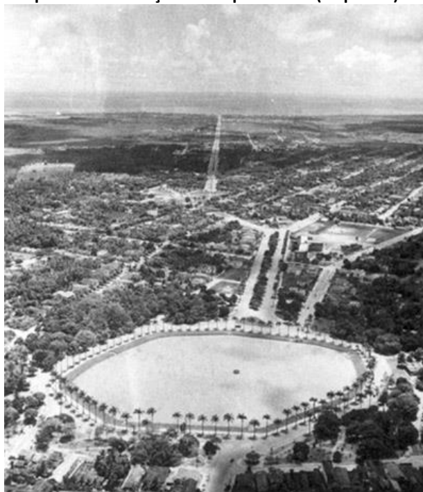
Figuras 1 e 2: Vista em primeiro plano do Parque Solon de Lucena e eixo da Avenida Epitácio Pessoa, partindo da Praça da Independência (esquerda) chegando ao mar (à direita) (Meados dos anos 1950)

Impelindo esse “desmesurado crescimento urbano”, dois movimentos distintos, porém complementares, conduziam a definição da nova imagem de cidade. A “corrida para o mar”, na forma da ampliação horizontal acelerada da mancha urbana guiada pela linha reta da Avenida Epitácio Pessoa, convertia em cidade o largo trecho entre o núcleo urbano e a região litorânea de Tambaú e Cabo Branco, da qual a capital estivera por séculos separada. Na outra ponta, o “crescimento para cima”, com a verticalização rompendo o gabarito de três andares até então predominante, tanto na área central, de forte densidade histórica, como junto às praias, que perdiam seu caráter de lugar de veraneio para abrigar uma crescente população de residentes, parte dela se alojando em edificações verticais erguidas sobre a areia, em meio ao coqueiral nativo.