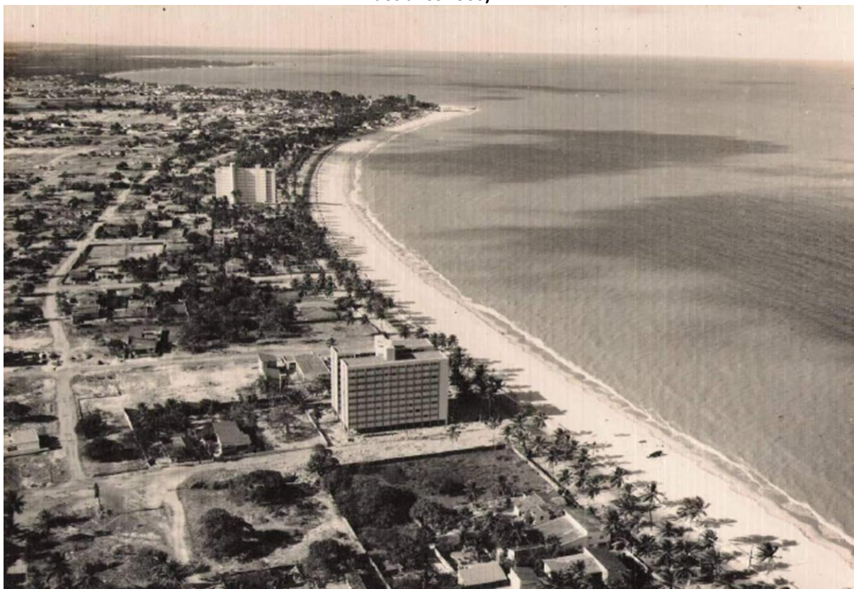
Figura 5: Vista aérea da praia de Cabo Branco, com os edifícios Borborema (1962) e Beira-Mar (1967). (Final dos anos 1960)