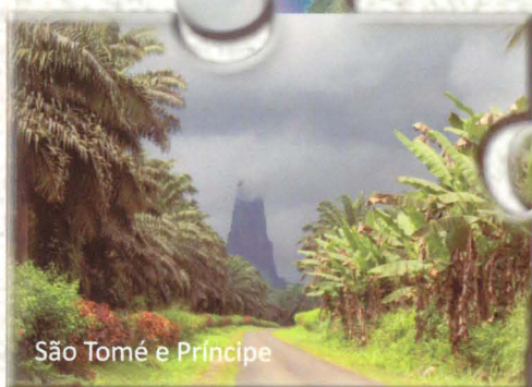
São Tomé e Príncipe