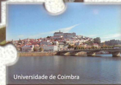
Universidade de Coimbra