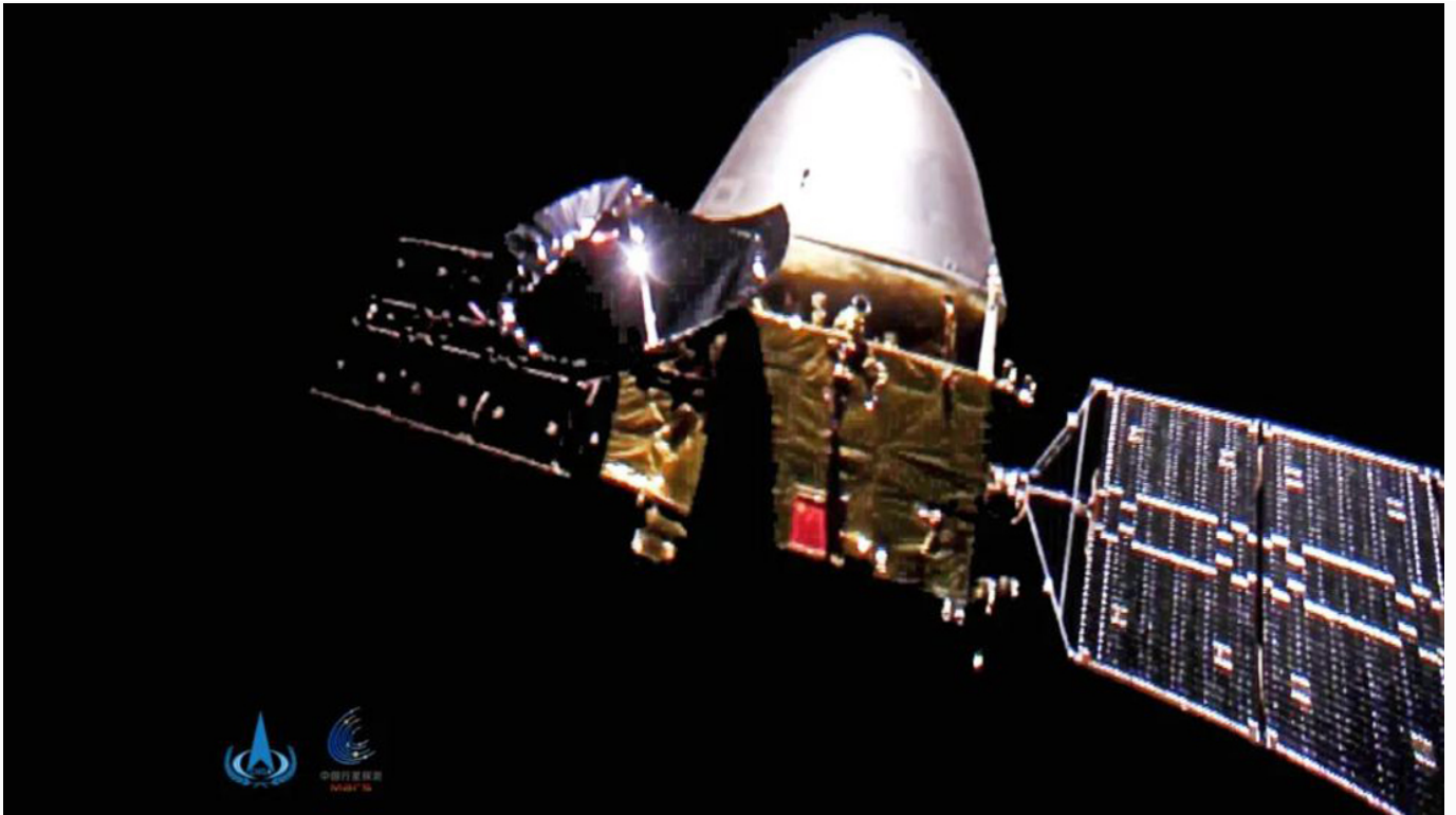
Figura 2 – A sonda Tianwen-1, fotografada por uma pequena câmera que foi ejetada da espaçonave quando estava a 24 milhões de quilômetros da Terra.

O local escolhido para pousar o rover é a Utopia Planitia , uma enorme planície com rochas vulcânicas onde, há mais de 30 anos, desceu a nave Viking 2 da NASA. O rover, que deve pousar no solo marciano somente no mês de maio, deve funcionar por cerca de 90 dias em solo marciano. Leva instrumentos para análise do solo, topografia, um magnetômetro, um radar que penetra o solo e que trará importantes informações sobre as camadas geológicas e, eventualmente, a presença de água. O orbitador carrega câmeras de alta resolução e instrumentos para análise do clima.