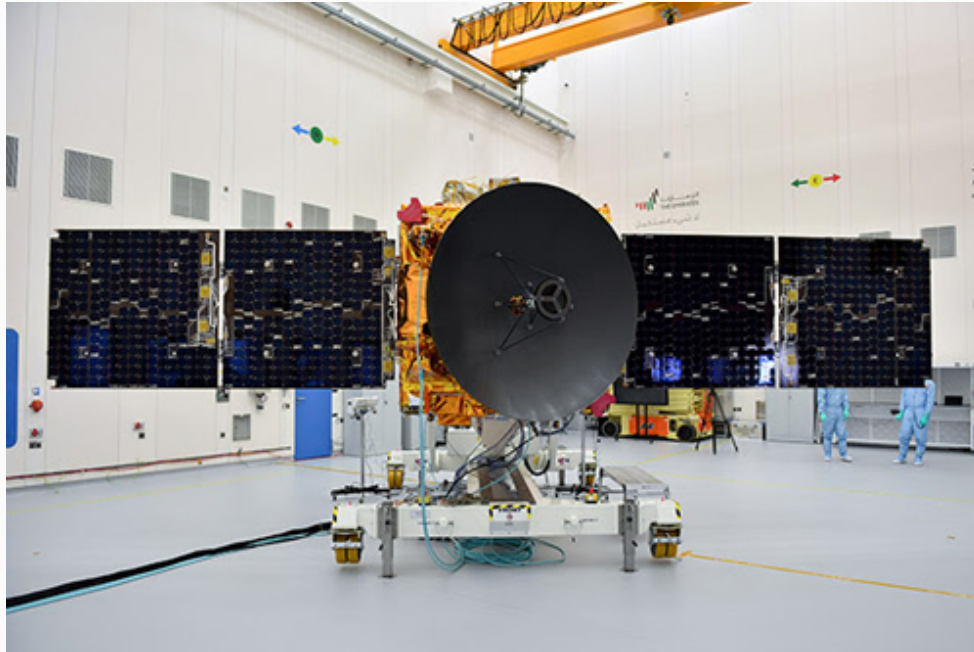
Figura 1 – A sonda Hope com seus painéis solares estendidos.

A primeira sonda que chegou em Marte foi a Al