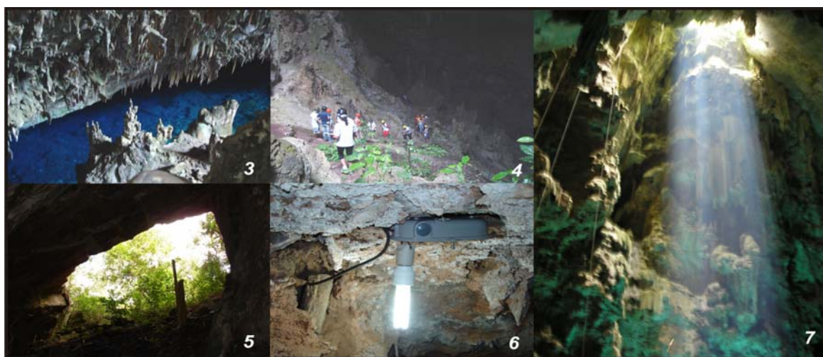
Figuras: 3 – Visão lateral da Gruta do Lago Azul; 4 – A falta de um corrimão no percurso de visitação é um ponto polêmico na Lago Azul. Alega-se que a sua presença poderia causar prejuízo estético ao patrimônio. Por outro lado, a sua ausência aumenta a dificuldade de acesso de pessoas menos preparadas fisicamente e idosos – grupos comuns no local; 5 – Pórtico de entrada da Gruta de São Miguel, e em detalhe (6), luz fluorescente compacta instalada em seu interior; 7 – Visão interna do pórtico de entrada do Abismo Anhumas.

O caso mais representativo que ilustra esta mudança de postura é a região da Serra da Bodoquena, com as grutas de Bonito, MS (Figuras 3 a 7). A tentativa de disciplinar a atividade espeleoturística na região é anterior até mesmo aos fatos citados, podendo ter como marco temporal e divisor de águas o projeto Grutas de Bonito , que apresenta diretrizes básicas para o manejo conservacionista das cavernas da região (LINO et.al. , 1984). Na mesma região, outros fatores externos ao espeleoturismo também concorreram para auxiliar nesta regulamentação, como a criação do voucher único, a obrigatoriedade dos guias locais no passeio e a criação do Conselho Municipal de Turismo – COMTUR –, que, até onde se sabe, é pioneiro no país (LOBO, 2006).