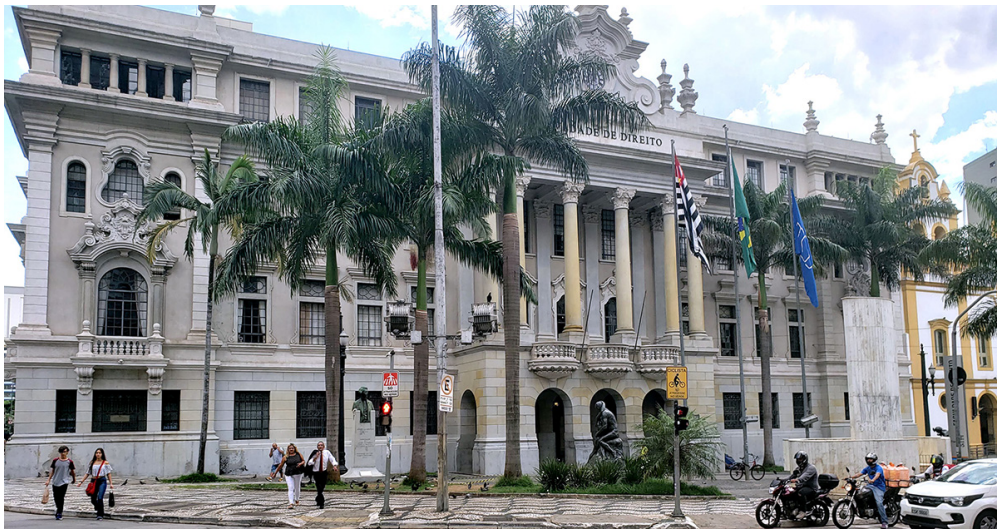
O projeto também é importante na revitalização do centro de São Paulo, valorizando o Largo de São Francisco e reforçando a sua história