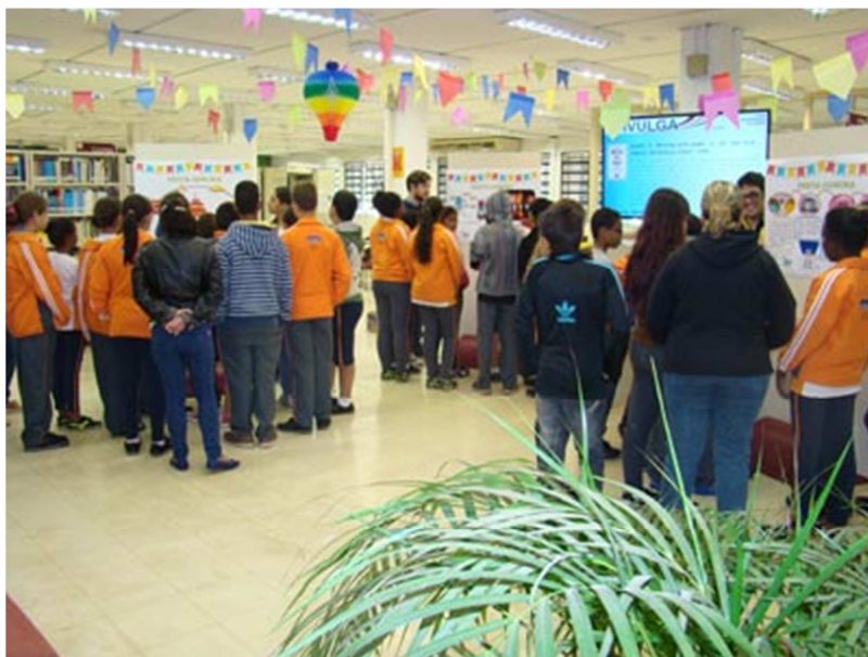
Crianças do Projeto

Pequeno Cidadão visitam a exposição A Química da Festa Junina – Fábio Boracini O novo conceito e layout da Biblioteca do Instituto de Química de São Carlos (IQSC) da USP – enriquecido com a parceria docente – tem permitido o oferecimento de várias atividades, como monitorias e aulas, além de treinamento em bases de dados.