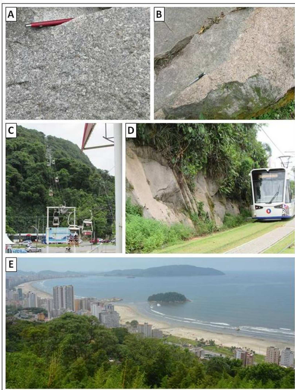
Figura 2 – Geossítio Granito Santos. A) Detalhe do afloramento. B) Intrusões pegmatíticas. C) Teleférico no Morro Voturuá. D) Passagem de pedestres e transporte sobre trilho ao lado do afloramento. E) Visão panorâmica do Morro Voturuá.

A Figura 2A apresenta em detalhe o afloramento do Granito Santos, evidenciando os minerais constituintes. Na Figura 2B são destacadas as intrusões pegmatíticas róseas que ocorrem ao longo de todo o maciço granítico. Destaca-se que o geossítio é parte do inventário do patrimônio geológico do estado de São Paulo (GARCIA et al., 2017).