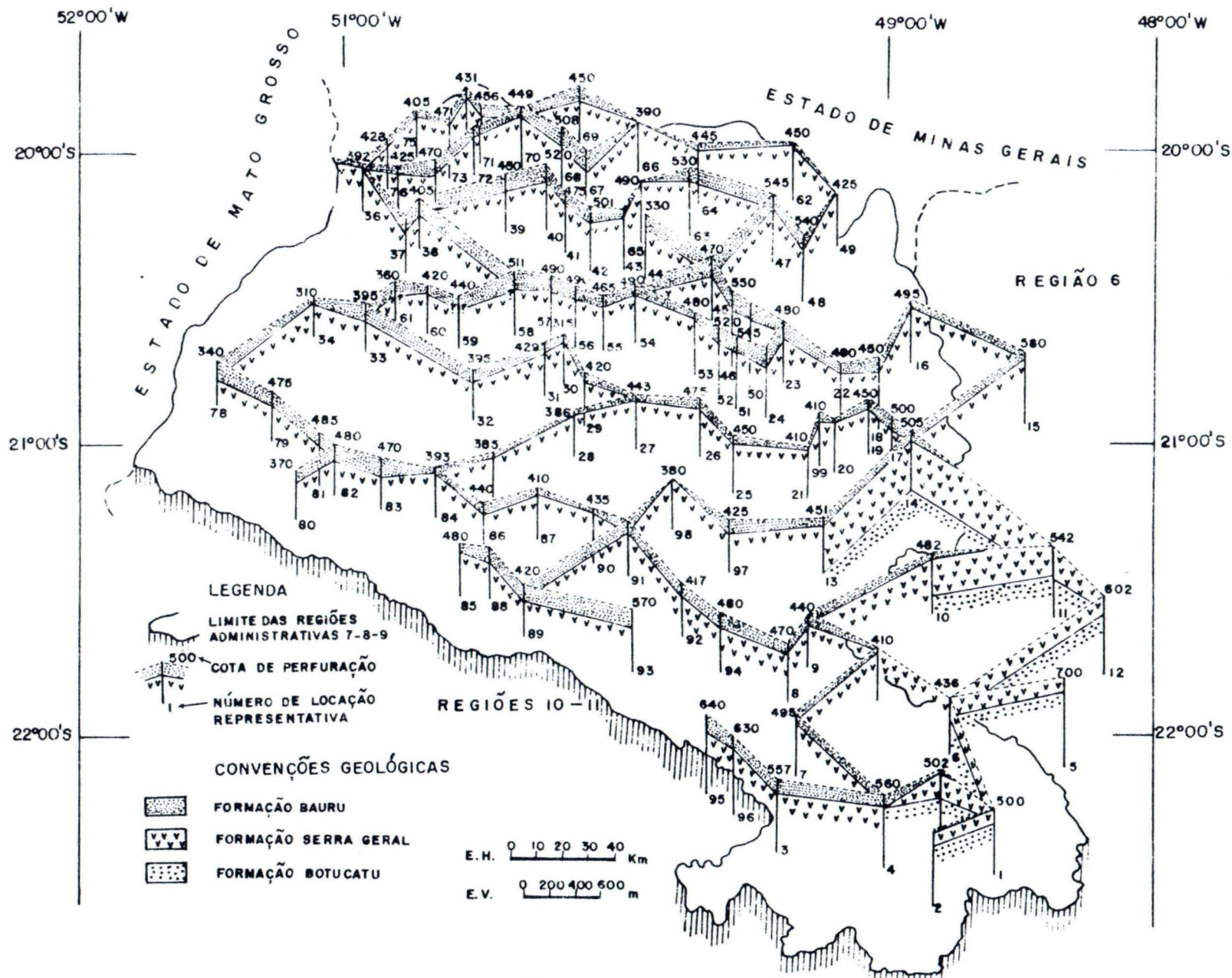
FIG. 2 - DIAGRAMA DE PAINEL DA FORMAÇÃO BAURU NAS REGIÕES ADMINISTRATIVAS 7, 8 E 9 (SÃO PAULO).