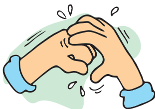
5 - Articulação