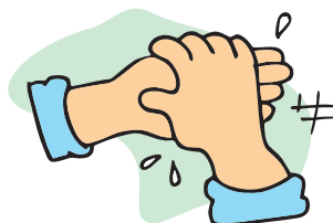
2 - Dorso das mãos