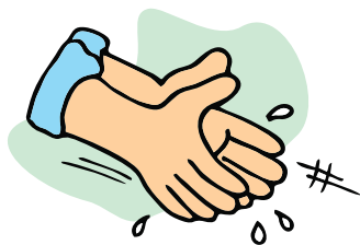
1 - Palma