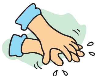
3 - Espaço entre os dedos