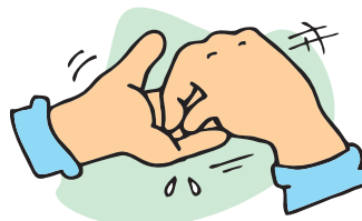
6 - Extremidades dos dedos e unhas