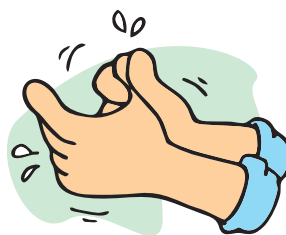
4 - Polegar