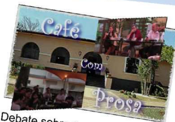
Debate sobre a Crise Financeira Mundial Exibições: 130