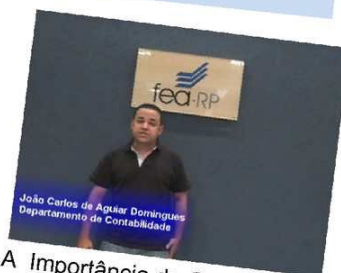
A Importância da Contabilidade para Pequenas e Médias Empresas Exibições: 351